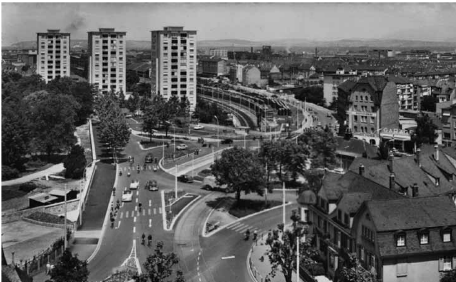
Die drei Hochhäuser mit je 50 Wohnungen der Entenweid-Genossenschaft sorgten in der Stadt für Diskussionen, international aber für Furore. (Ansichtskarte aus den 1950er-Jahren)