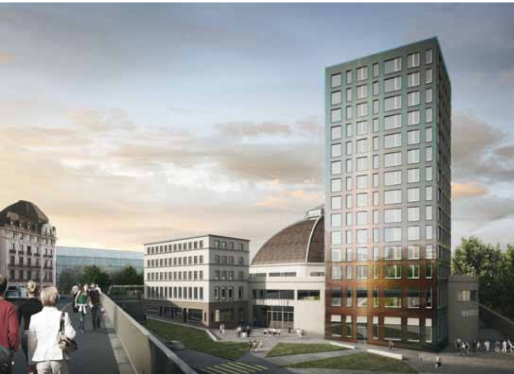
Inzwischen kurz vor der Fertigstellung des Rohbaus: Das 50 Meter hohe Wohnhochhaus an der Markthalle nach Plänen von Diener & Diener