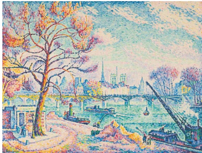
Rang eins: Paul Signacs „Pont des Arts (Paris)“ von 1925, 89,3 mal 116,5 Zentimeter groß, erreicht bei Koller in Zürich 4,6 Millionen Franken. Fotos Kataloge

der hundertfünfzigjährigen Geschichte des Hauses. Neben den 46 Chagall-Werken als Höhepunkt gab es im Jubiläumsjahr in Bern zwei Überraschungen: Oskar Schlemmers auf 250 000 Franken taxiertes Ölgemälde „Familie“ von 1928 stieg auf 760 000 Franken, und Jean Tinguelys 1955 konstruierte „Méta-mécanique“ erzielte mit 400 000 Franken einen neuen Schweizer Auktionsrekord für den Künstler. Insgesamt sieben Millionen Franken weisen die Basler Beurret & Bailly in ihrer Statistik aus. Parallel zur Art Basel erreichten sie im Juni ein internationales Publikum, das der Moderne und Nachkriegskunst zugeneigter war als älterer Kunst. TILO RICHTER